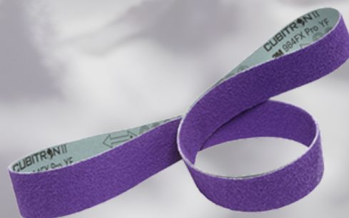
3M™ Cubitron™ 3 Brúsny pás 1184F