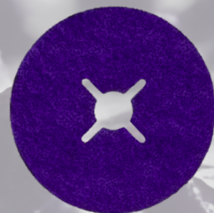
3M™ Cubitron™ 3 Fíbový disk 1187C