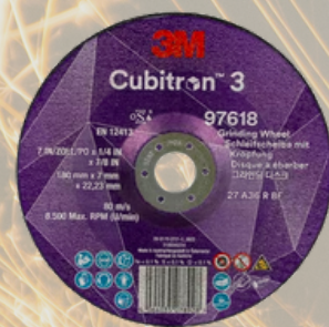
3M™ Cubitron™ 3 Brúsny kotúč