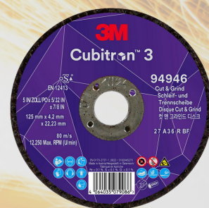
3M™ Cubitron™ 3 Brúsnorezný kotúč