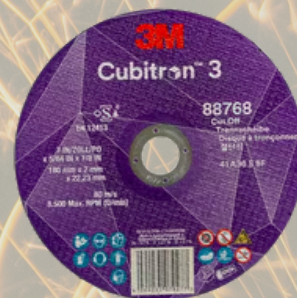
3M™ Cubitron™ 3 Rezný kotúč