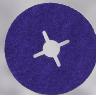
3M™ Cubitron™ 3 Fíbový disk 1182C

zvýšený brúsny výkon Viac odobraného materiálu. vs. Cubitron 2